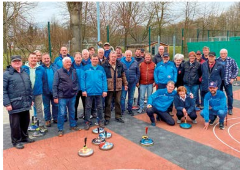
Die Teilnehmer des Osterturniers der Stockschützen Illmünster