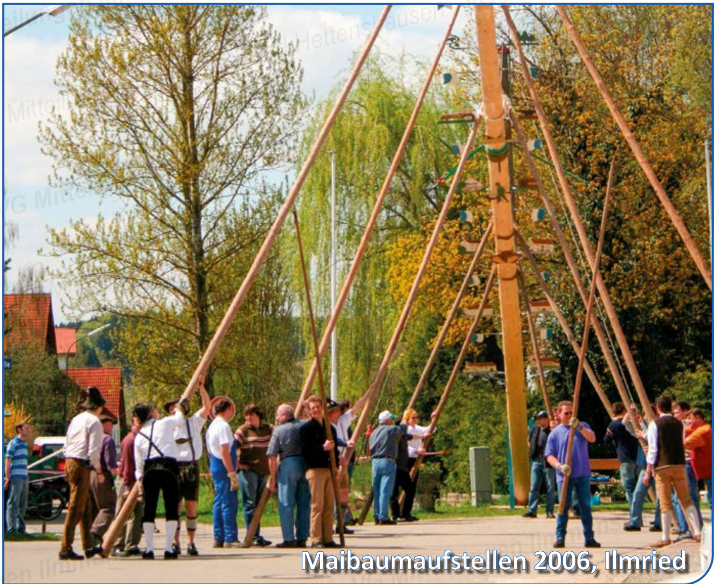
Maibaumaufstellen 2006, Ilmried

MITTEILUNGSBLATT FÜR DIE VERWALTUNGSGEMEINSCHAFT DER GEMEINDEN ILMMÜNSTER UND HETTENSHAUSEN