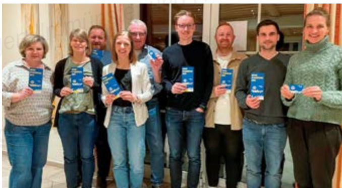
Einige anwesende Mitglieder mit der neuen EDEKA-Vereinskarte

Am 27. Juni 2026 wird es dazu eine Jubiläumsveranstaltung geben, bei der alle Abteilungen beteiligt sind und wieder viele helfende Hände gebraucht werden.