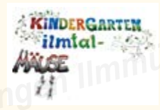
Bilder und Text: Kiga Hettenshausen/Elternbeirat

Neben all diesen besonderen Aktionen nutzten wir die ersten warmen Tage für Spaziergänge und entdeckten dabei, wie der Frühling langsam erwacht.