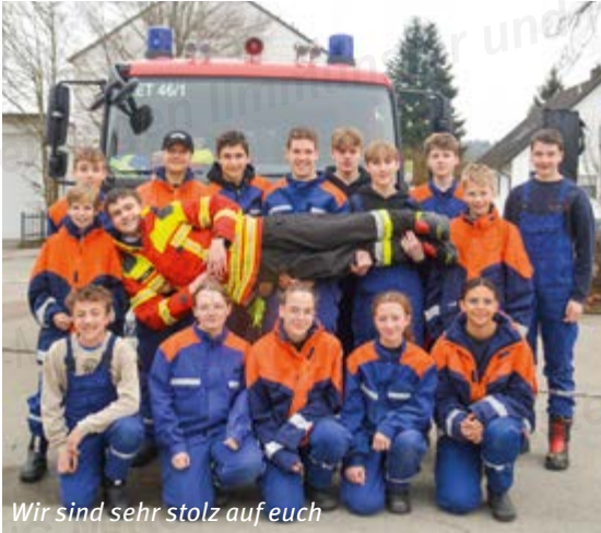
Wir sind sehr stolz auf euch

Im März legten 16 Mädls und Jungs unserer Jugendgruppe erfolgreich die bayrische Jugendflamme Stufe 1 ab. Bei dieser Prüfung mussten unsere Jugendlichen ihr feuerwehrtechnisches Wissen und Können unter Beweis stellen. 5 Teilaufgaben, unter anderem der Umgang mit Schläuchen und Armaturen, als auch Knotenkunde mussten bewältigt werden.