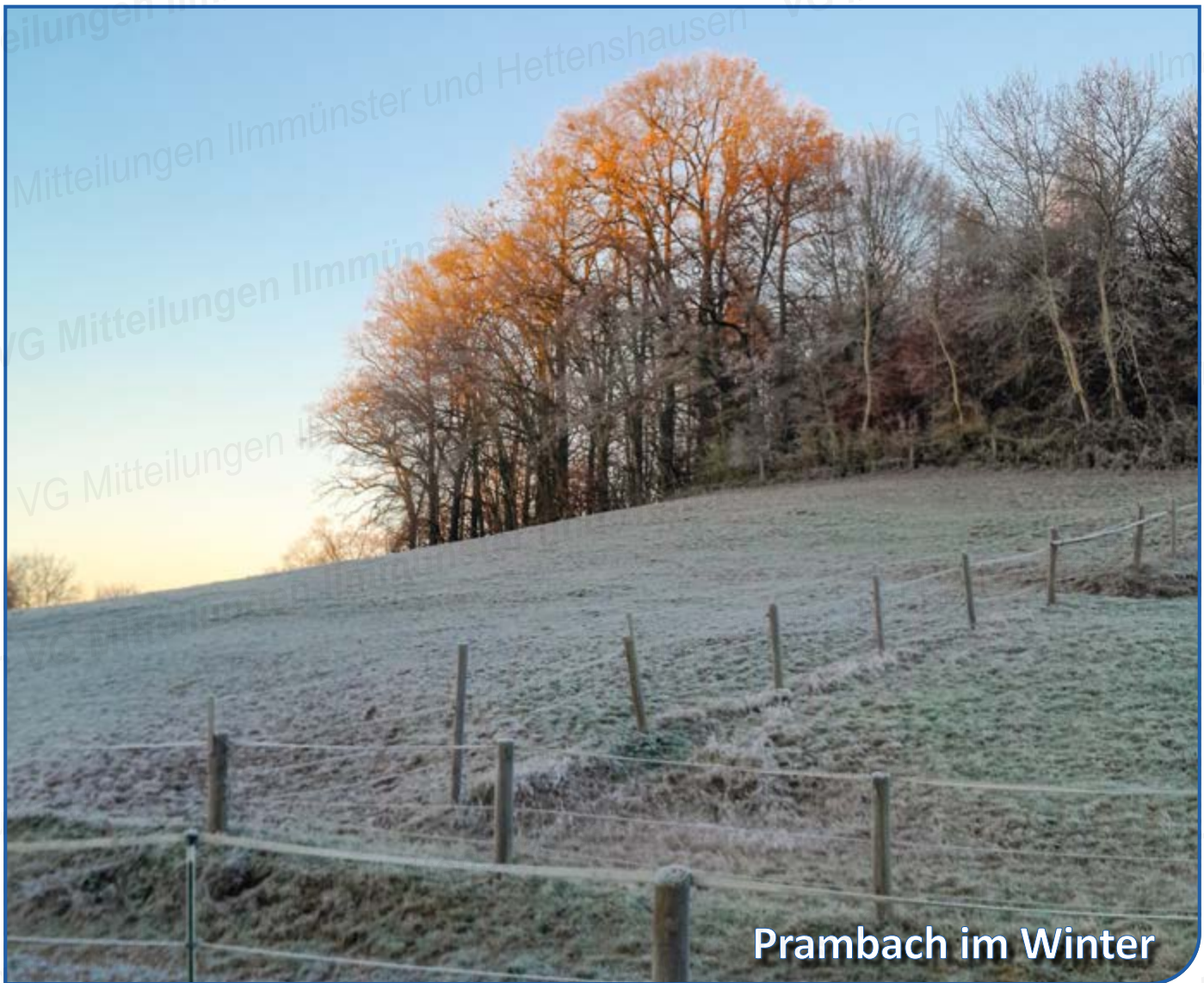
Prambach im Winter

MITTEILUNGSBLATT FÜR DIE VERWALTUNGSGEMEINSCHAFT DER GEMEINDEN ILMMÜNSTER UND HETTENSHAUSEN