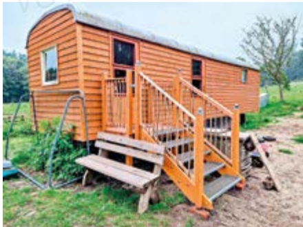
Der neu renovierte Bauwagen

Das Ergebnis dieses Aufwands kann sich sehen lassen. Der Bauwagen erstrahlt in neuem Glanz und ist bereit für die nächsten Generationen kleiner Abenteurer.