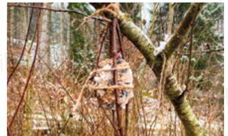
Selbst hergestelltes Vogelfutter

Bilder und Text: Waldkindergarten Ilimmünster