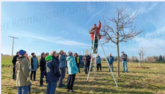
Zahlreiche Teilnehmer beim Obstbaumschnittkurs im März 2024

Bereits zum zweiten Mal findet durch den Obst- und Gartenbauverein Illmünster-Hettenshausen ein Schnittkurs in Hettenshausen auf der gemeindlichen Fläche hinter dem Spielplatz „Langer Riegel“ statt. Willkommen sind alle inte-